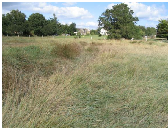
Figure 29 : Prairie subhalophile

PRAIRIES SUBHALOPHILES MESO-HYGROPHILES A JONC DE GERARD ET VULPIN BULBEUX - Alopecuro-bulbosi-Juncetum gerardii (Bouzillé, 1992)