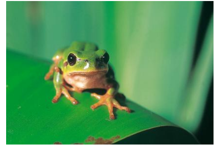
Figure 82 : Rainette verte

La Rainette verte a une vaste aire de répartition : du sud de l'Espagne au sud de la Suède, elle atteint l'Oural et le Caucase à l'est. Largement répartie dans l'est de la Bretagne, en Ille et Vilaine, en Loire-Atlantique et dans l'est du Morbihan, elle devient plus rare à l'ouest de la Bretagne où elle est localisée dans les marais littoraux.