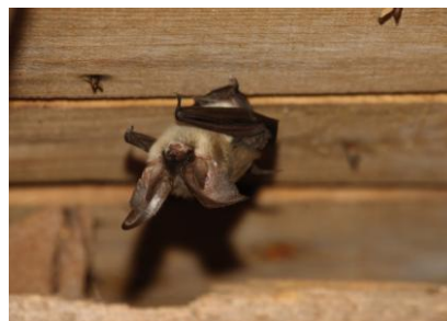
Figure 109 : Oreillard gris

Il existe une donnée ancienne (1998) d'hibernation de l'Oreillard gris dans le château de Suscinio et il y a plusieurs données de l'espèce sur les communes concernées par le périmètre Natura 2000. Une nurserie a été observée au château du Grégo à Surzur, un individu en hibernation à Ambon, ou encore un individu en chasse au Roaliguen à Sarzeau.