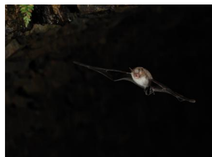
Figure 107 : Murin de Natterer

Cette espèce est présente aussi bien dans les massifs forestiers que les milieux agricoles extensifs où l'habitat humain est dispersé et elle s'adapte facilement aux zones urbanisées. En hiver, c'est une chauve-souris typiquement cavernicole : grottes, caves, mines, tunnels, pont hors gel. Les gîtes estivaux de l'espèce sont très diversifiés, situés aussi bien dans les arbres, les bâtiments, les ponts, les fissures de falaise. L'animal montre un net attrait pour le confinement : loges étroites ou en cul de sac et anfractuosités diverses. Les colonies se fixent dans les cavités arboricoles, les nichoirs, les linteaux de bois, les parpaings. Très fidèle à leur gîte, ces murins y reviennent chaque année avec constance, qu'il soit nocturne ou diurne. Les déplacements entre gîtes d'été et d'hiver sont habituellement courts, de l'ordre d'une trentaine de kilomètres.