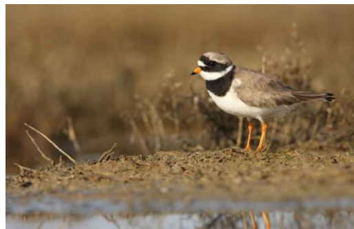
Figure 69 : Grand Gravelot

L'aire de reproduction s'étend de la toundra arctique aux zones boréales et tempérées d'Europe, jusqu'en France. L'aire d'hivernage occupe une vaste superficie, depuis les rivages de la Mer du Nord (Angleterre, Pays-Bas) jusqu'à l'Afrique tropicale.