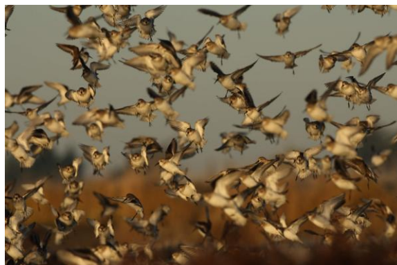
Figure 57 : Bécasseau variable

L'aire de reproduction s'étend de l'Islande à la Sibérie, surtout au niveau de la toundra arctique. Pendant l'hiver, les oiseaux occupent les rivages côtiers, essentiellement au niveau des baies et estuaires abrités, depuis le Danemark jusqu'au bassin méditerranéen et l'Afrique de l'ouest.