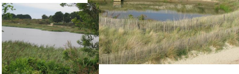
Figure 33 : Dépressions humides intradunales